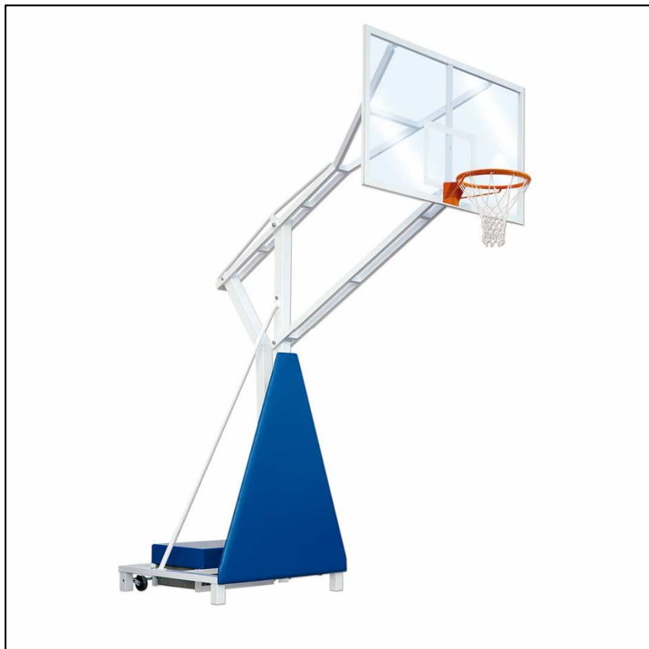
IMAGEN Y DIMENSIONES